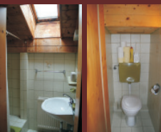
Dusche/ WC/ Separat Separat