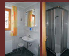
Dusche/ WC 1